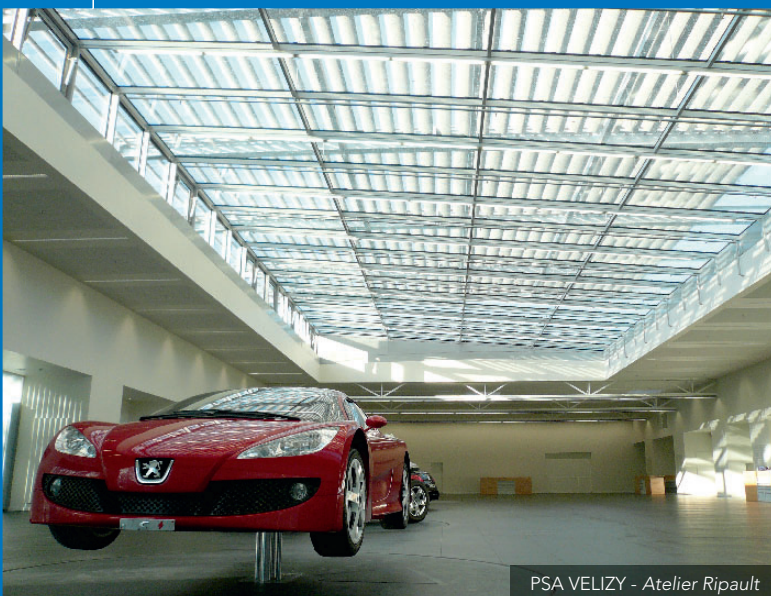
PSA VELIZY - Atelier Ripault